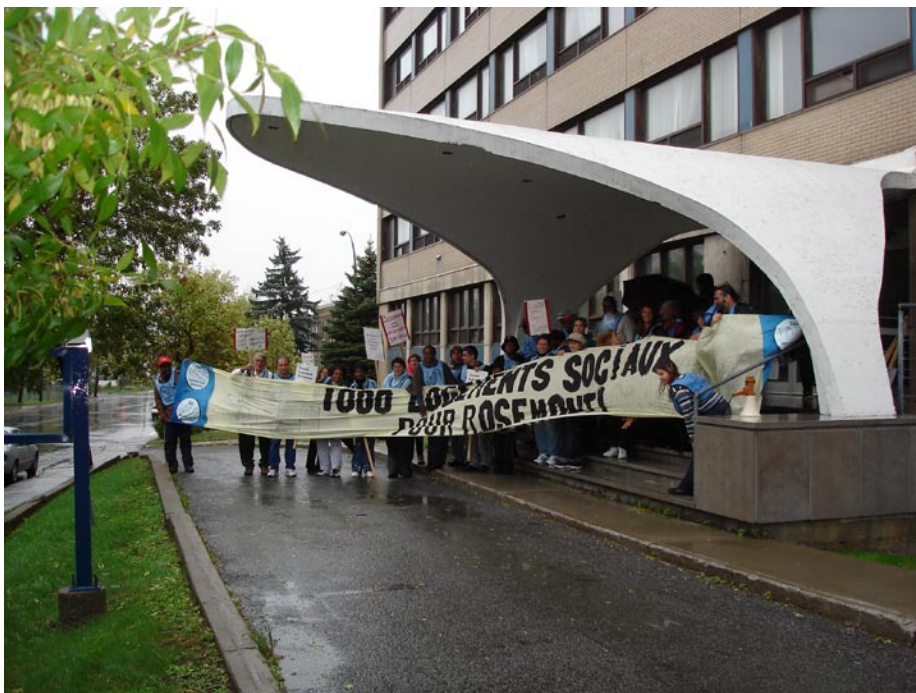
À l'automne 2005, des centaines de citoyens et des dizaines de groupes communautaires du quartier se mobilisent dans diverses actions pour empêcher la vente de l'immeuble à un promoteur privé. Le résultat de ces pressions est positif, le ministère de la Santé s'engage à vendre l'immeuble à LOGGIA.